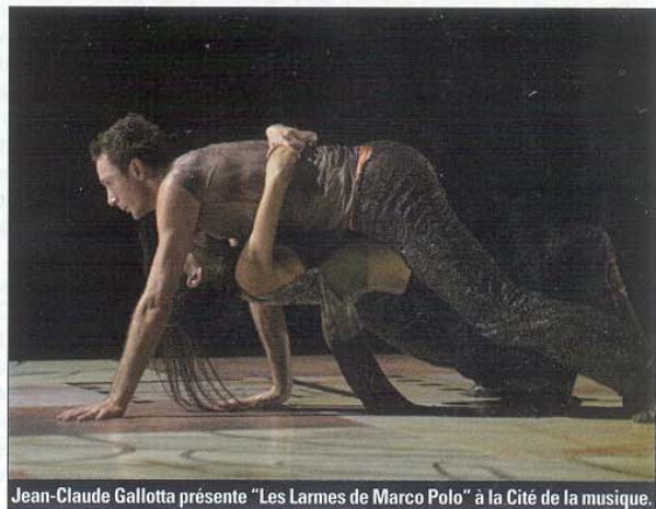
Jean-Claude Gallotta présente "Les Larmes de Marco Polo" à la Cité de la musique.

■ Les Gêmeaux, Sceaux, 92. Tél. 01 46 61 36 67 64. Jusqu'au 28 mars (en alternance).